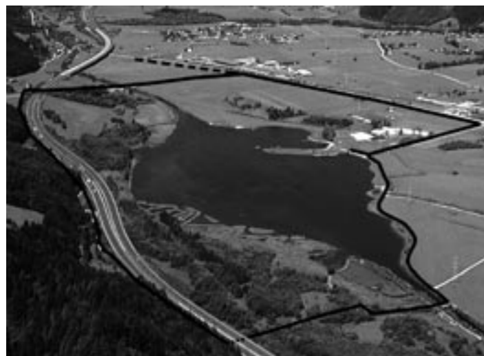
Radweg rund um den See

In weiten Teilen Österreichs hat der Winter in voller Kraft Einzug gehalten. Die weiße Pracht – des Wintersportlers Freud, der Hausbesitzer Leid – deckt ihren weißen Mantel über das Land. Und damit verbunden steigt auch wieder die Gefahr von Dachlawinen.