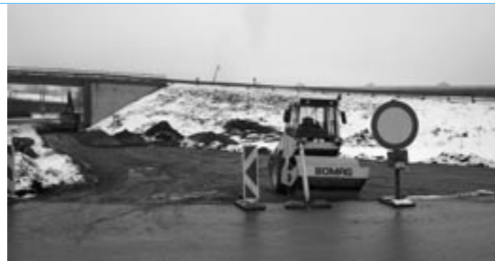
Industriezufahrt von Westen voll in Arbeit

vorriefen. Auch unsere Volkskulturveranstaltung Ende August hat eine Botschafterfunktion und der Adventabend am Donnerstag voriger Woche zeigte einmal mehr, dass in unserem Ort Kultur gelebt und gepflegt wird.