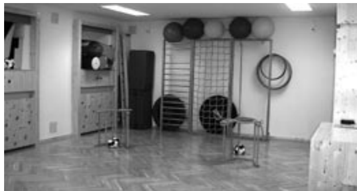
1. Baustufe Umbau Gemeindeamt mit Bücherei heuer abgeschlossen. Durch den nach neuesten Erkenntnissen gebauten Turnsaal für Kindergarten wird Ersatz für fehlende Freiflächen geschaffen

Nachdem unsere Bediensteten im Amt die erforderlichen Ausbildungsgänge in Bälde abschließen werden, sind wir personell auf gutem Weg.