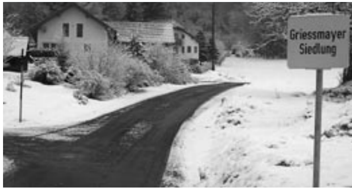
Asphaltierung Griessmayersiedlung abgeschlossen

wir unverzüglich im Frühjahr. Zusätzlich haben wir die aufschließende Zufahrtsstraße zum neuen Industriegrund errichtet und gleichzeitig auch in diesem Gebiet die Wasserversorgung mitverlegt.