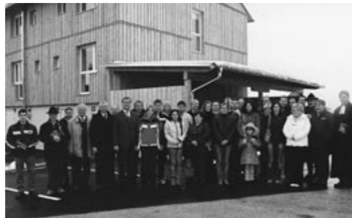
Neuer Wohnraum geschaffen. Übergabe des 9-Familienwohnhauses.

Die Gemeindevertretung sowie die Angestellten der Marktgemeinde Gaishorn am See wünschen besinnliche Weihnachtstage und ein erfolgreiches und gesundes Jahr 2008.